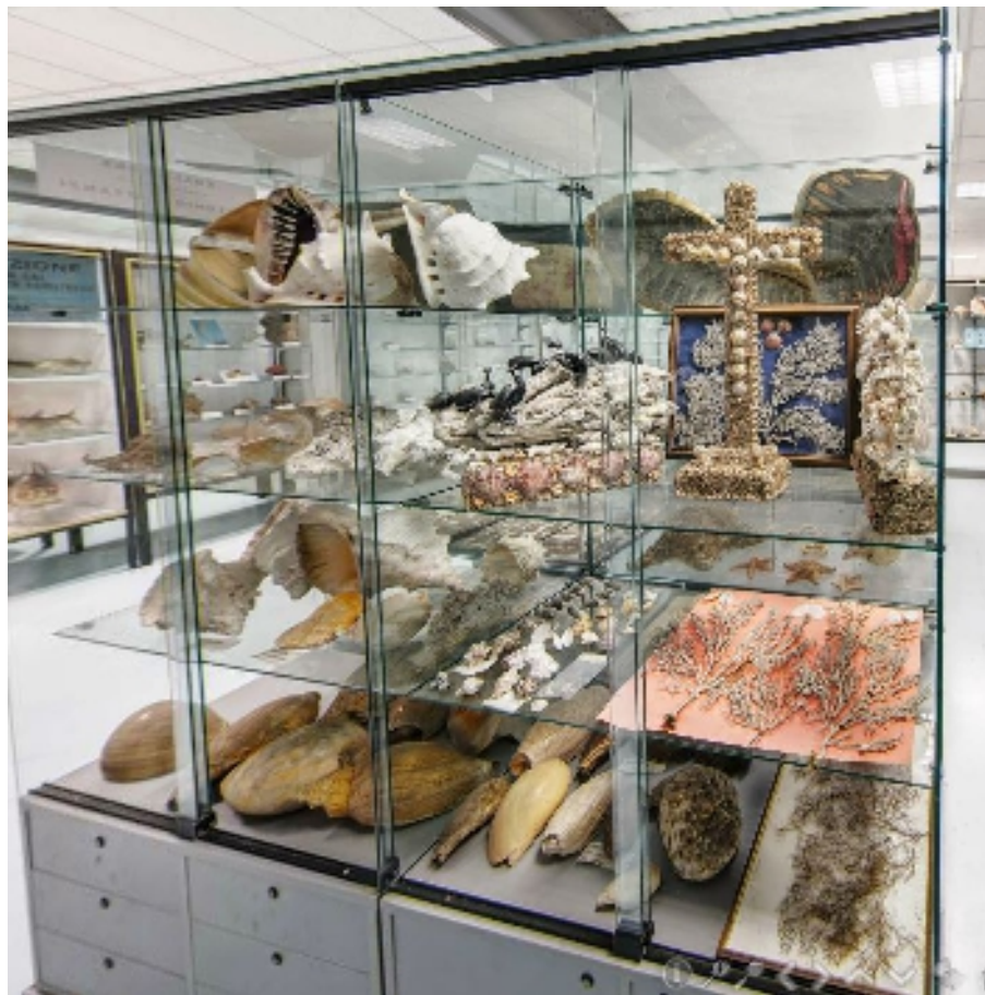
Corsia 5 – Lato M (conchiglie e coralli)