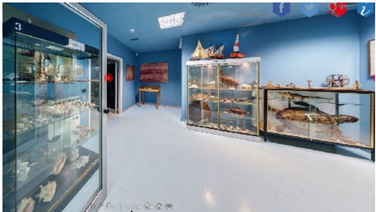
Atrio Museo – vetrine