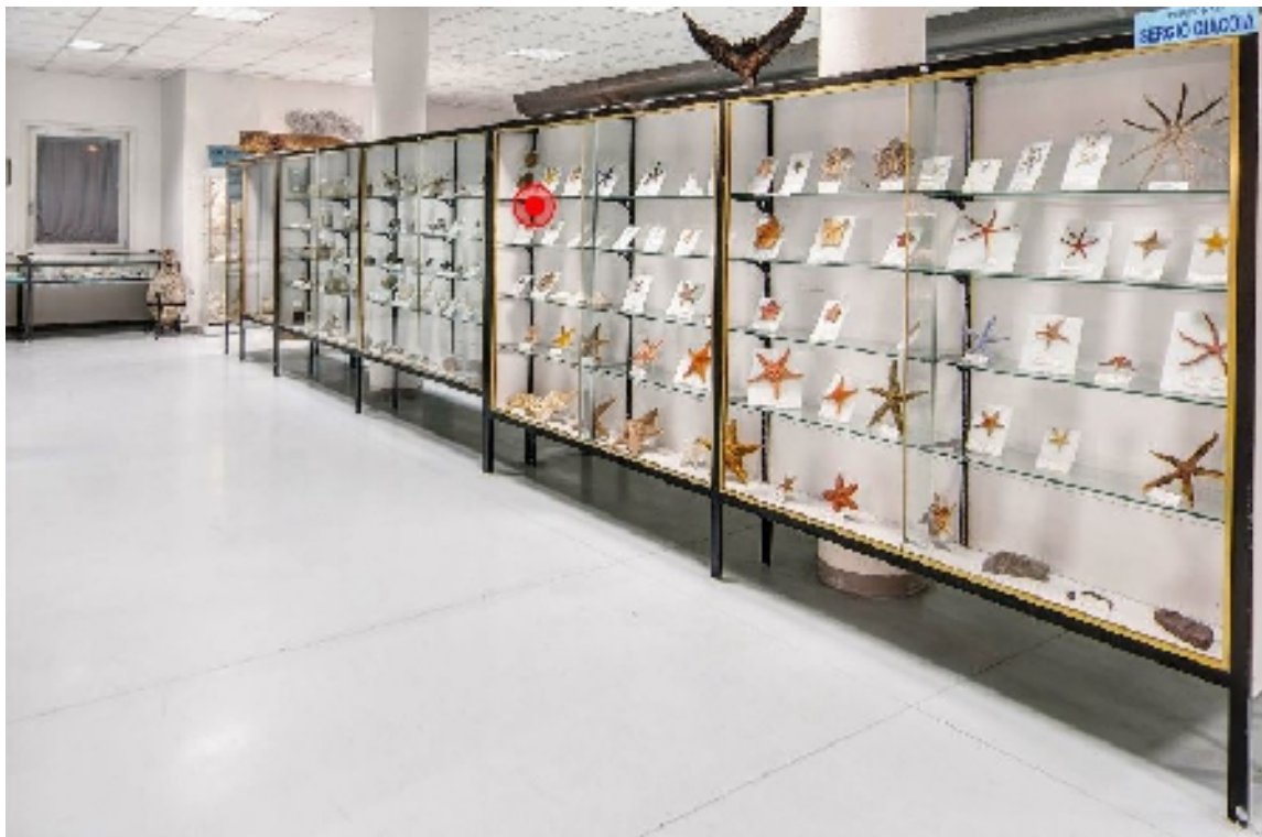
Corsia 5– Lato A (sopra) e Lato G (sotto)