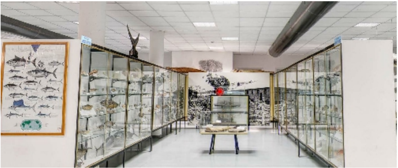
Corsia 4 – Lati A - B – C – D (vetrine e reperti appoggiati)