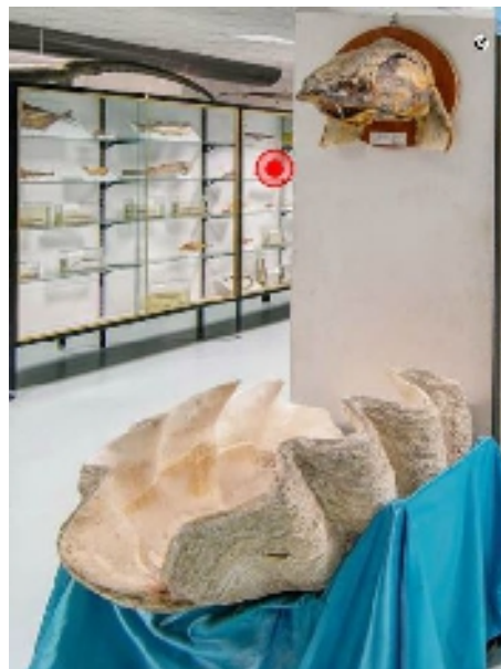
corsia 7 (reperiti da appoggiare/appendere)