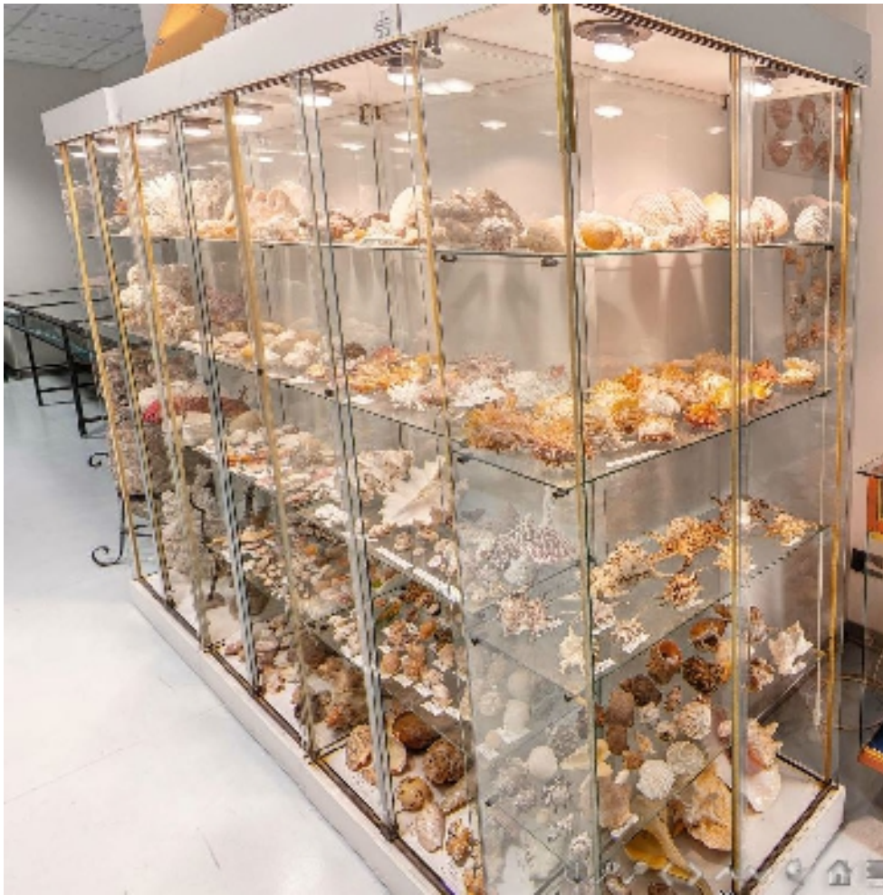
Corsia 6 – Lati B e C (conchiglie)