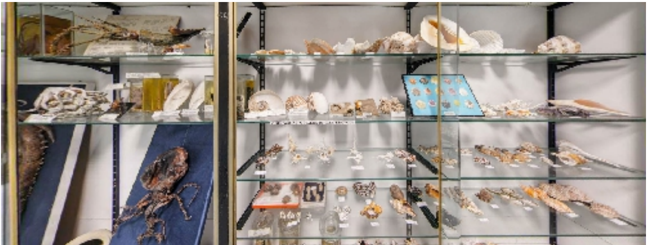
Corsia 5– Lato H (conchiglie e crostacei) lato est