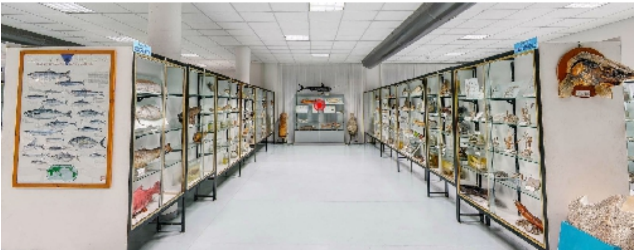
Corsia 2 – Lati A e B (vetrine e teche)