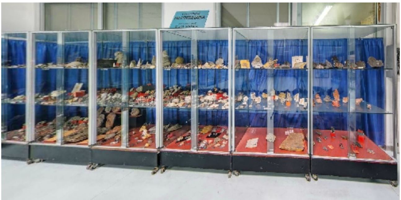
corsia 7 lato B (paleontologia)