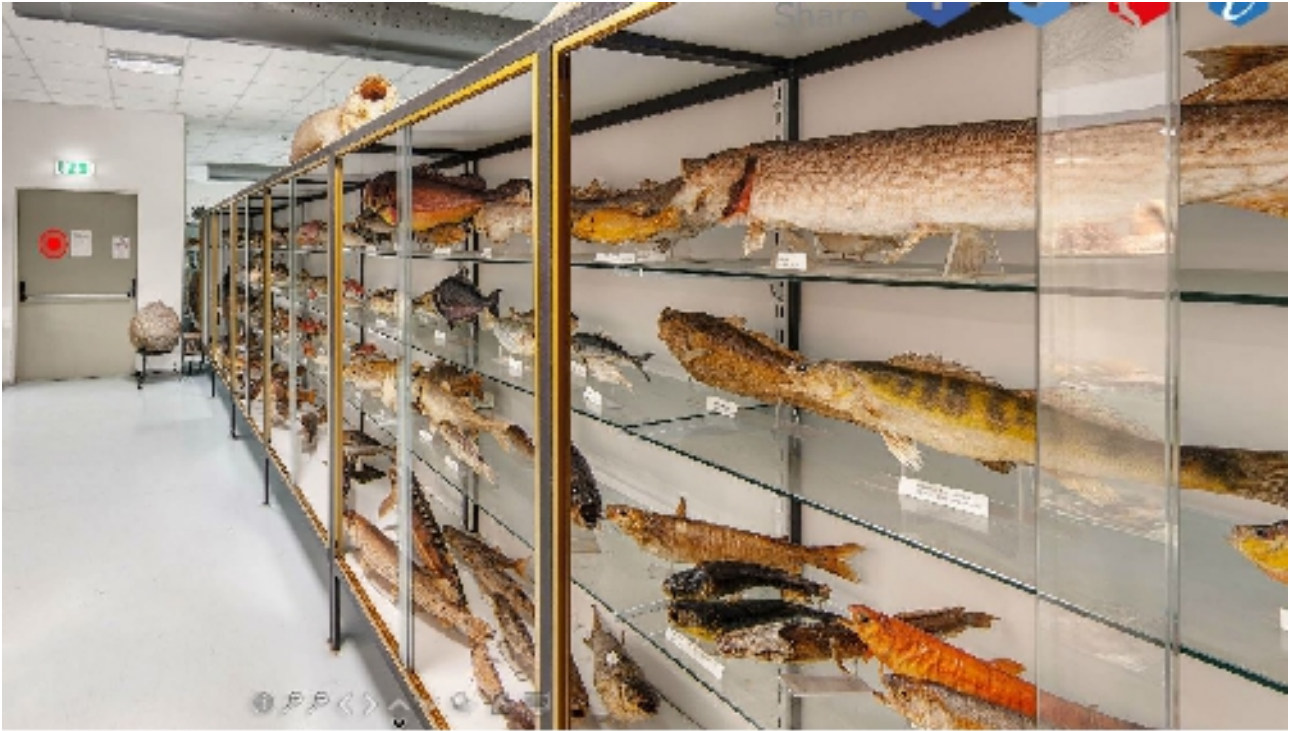
Corsia 6 – Lato A