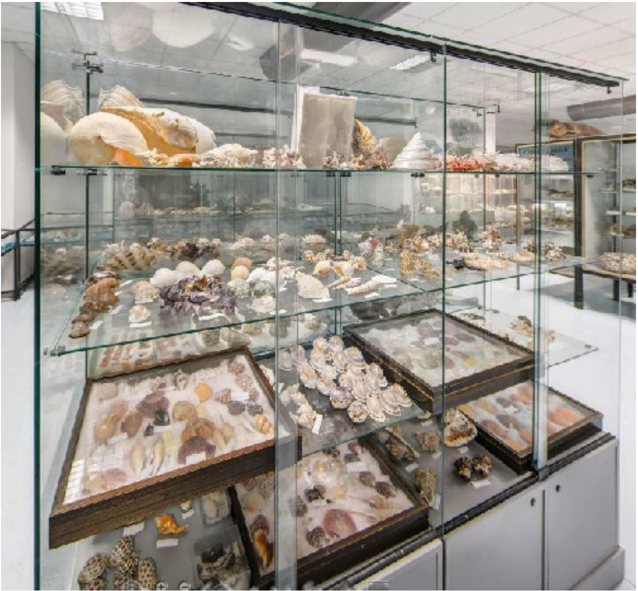
Corsia 5– Lato I