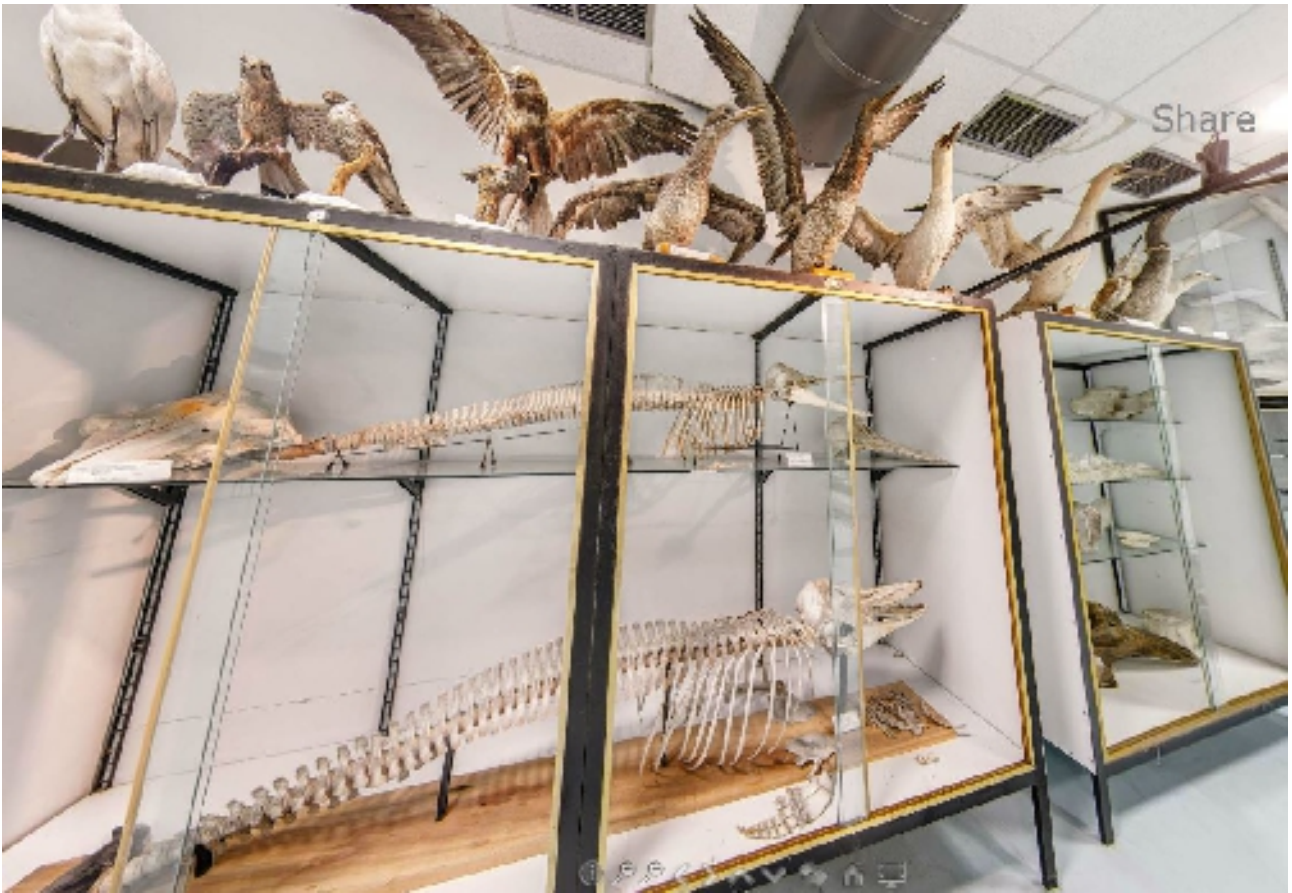
corsia 7 lato C (uccelli marini)