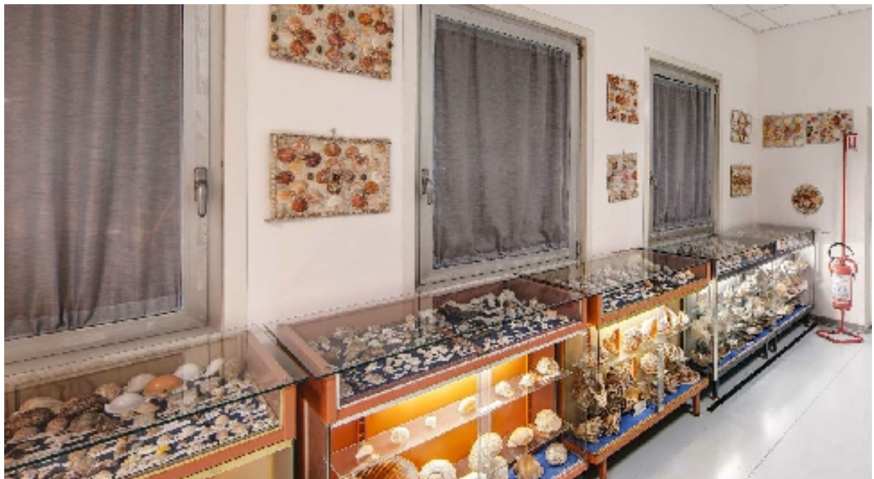
Corsia 6 – Lato D (conchiglie) sottofinestra