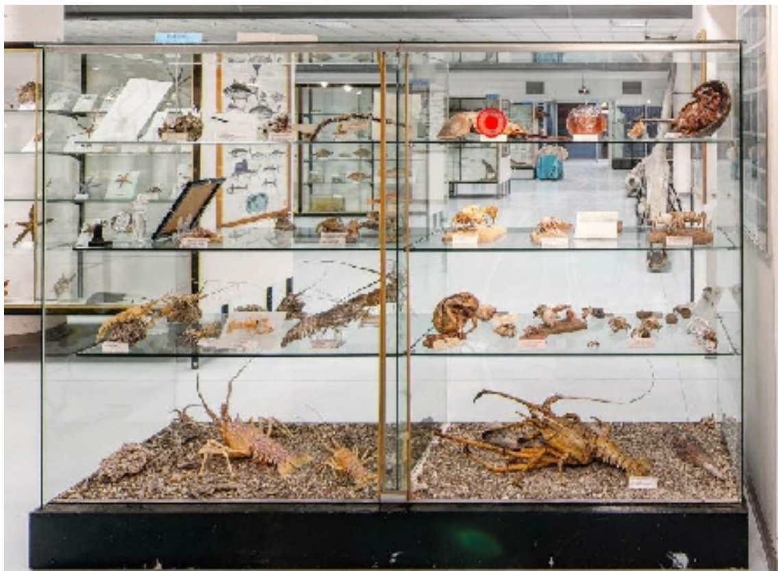
Corsia 5 – Lato B (crostacei)