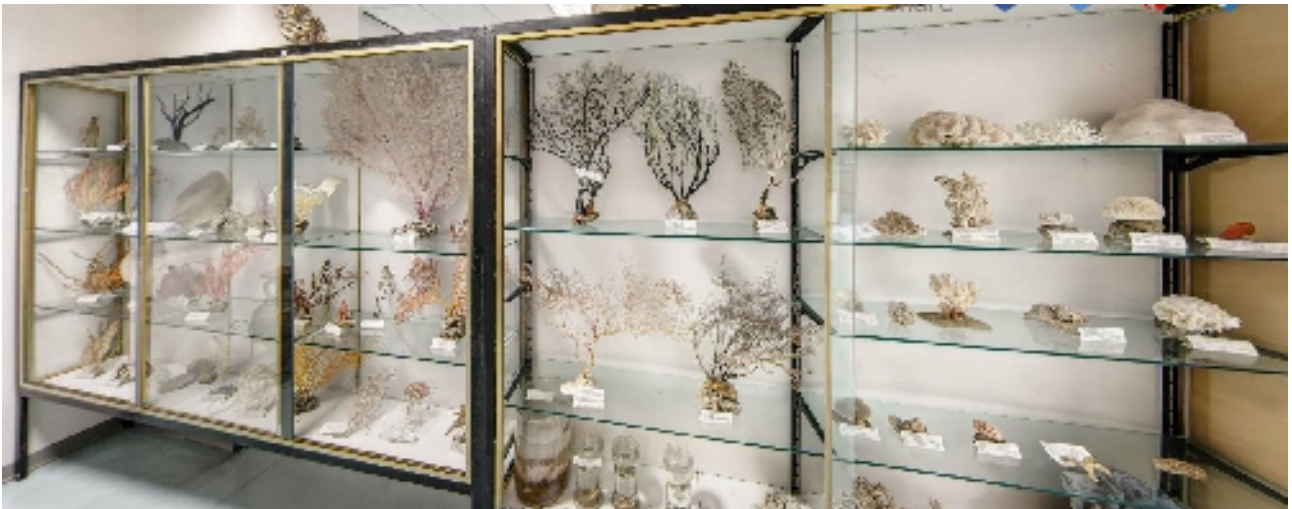
Corsia 5– Lato H (coralli) lato ovest