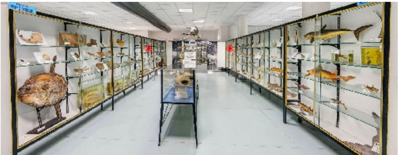
Corsia 3– Lati A - B – C – D (vetrine e reperti appesi/appoggiati)