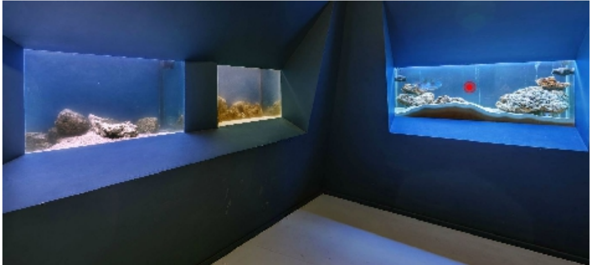
Acquari – ingresso Museo