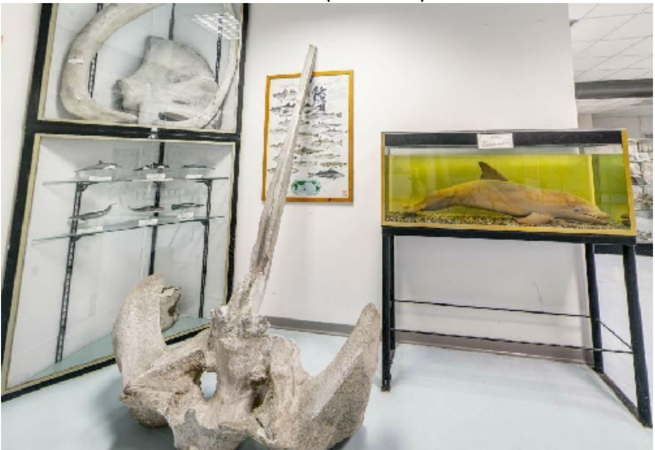
corsia 7 lato C (reperto delfino e altro reperto da appendere/appoggiare)