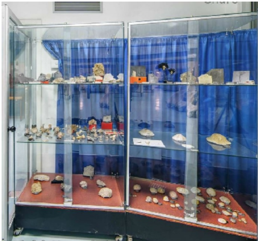
corsia 7 lato A (paleontologia)