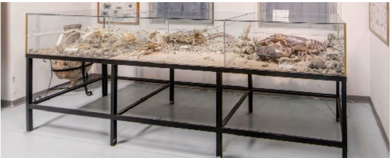
Corsia 5 – Lato L (crostacei) sottofinestra