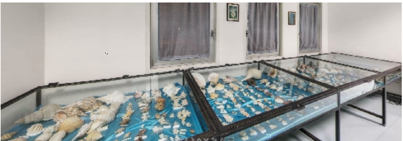
Corsia 5– Lato N (sottofinestra)