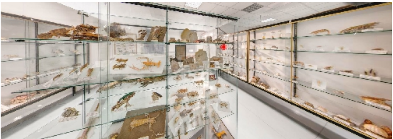
Corsia 5– Lati B – C – D – E - F (vetrine e reperti appoggiati)