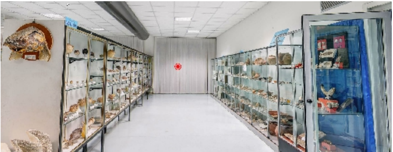
Corsia 1 – Lati A e B (vetrine)