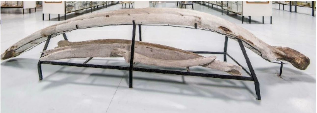
Corsia 7 – reperto (da appendere/appoggiare)