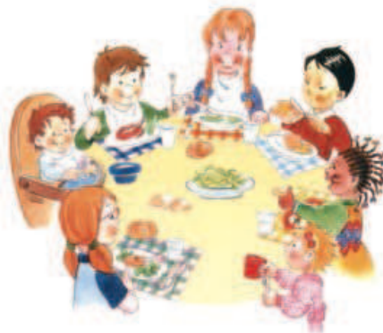
Menù Scuole Infanzia