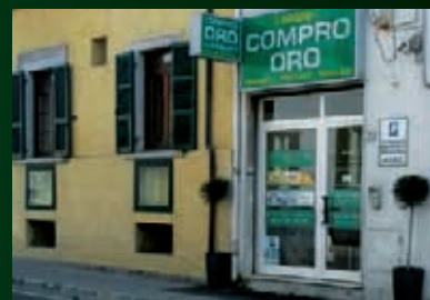
VIA SILVIO PELLICO 1

Via Mentana 6 - San Benedetto del Tronto - angolo viale S. Moretti (angolo isola pedonale) tel. 0735 583895