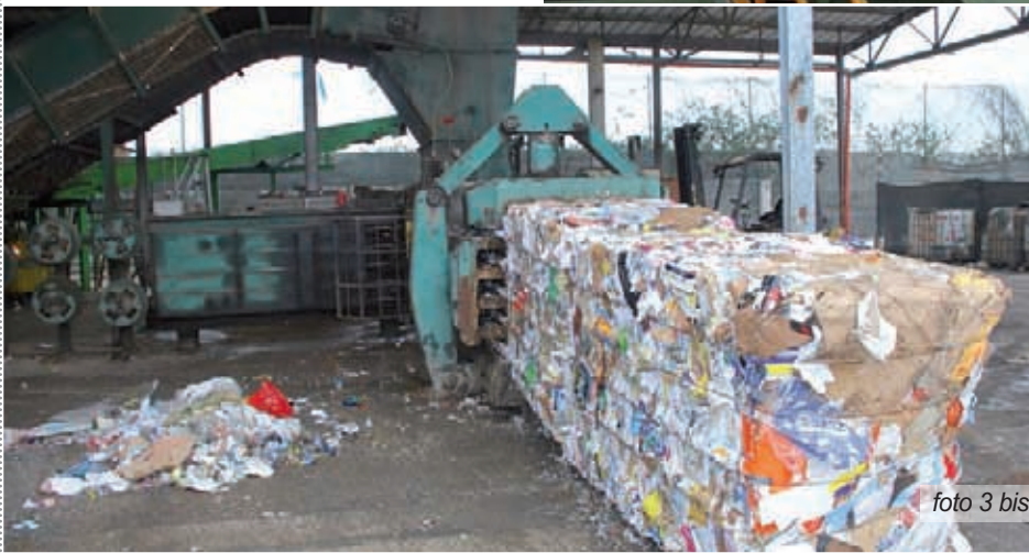
foto 3 bis

(cioè i consorzi delle aziende che riutilizzano i materiali), soprattutto utilizzando macchinari di pressatura per realizzare balle di carta (foto 5), balle di plastica (foto 6 e 7), balle di metalli ferrosi e non ferrosi, ecc. (foto 3bis). I materiali vengono dun-