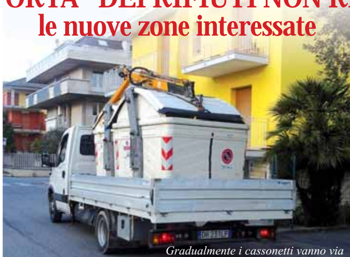
Gradualmente i cassonetti vanno via

Prosegue secondo le tappe previste il processo di graduale estensione a tutta la città del servizio di ritiro “porta a porta” dei rifiuti indifferenziati, quelli cioè che si gettano nel normale sacchetto dell’immondizia. Da questo mese di aprile inizieranno a sparire i cassonetti nelle zone della SS.