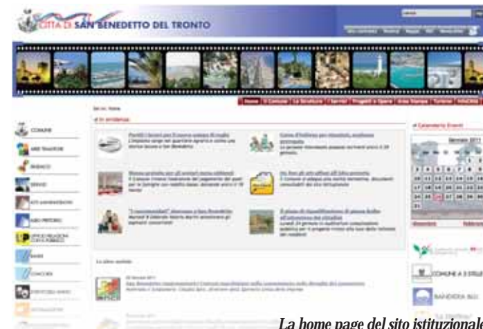
La home page del sito istituzionale

L'Albo pretorio comunale è il mezzo di pubblicità previsto dalla legge non solo per gli atti