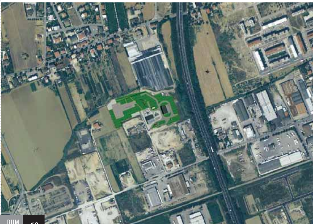
Veduta aerea dell'area dove sorge il deposito

Il progetto prende in esame tutti gli aspetti potenzialmente critici del nuovo insediamento. L'area si trova in zona E2