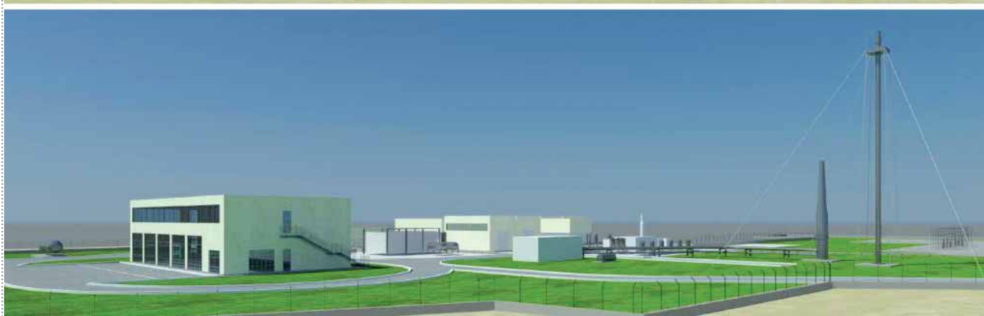
Una ricostruzione al computer di come si presenterà la zona su cui sorgeranno gli impianti tecnici del deposito