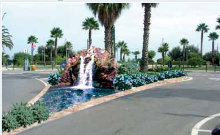
Due ricostruzioni al computer di come sarà la nuova “Via del Mare”

Vista la lunghezza della via (circa 1,1 chilometri) e le risorse al momento a disposizione, l'intervento verrà realizzato per stralci. Si inizierà nel tratto di circa 300 metri compreso tra il lungomare Rinasci-