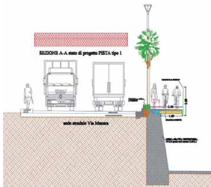
La pista ciclabile sull'Albula vista in sezione