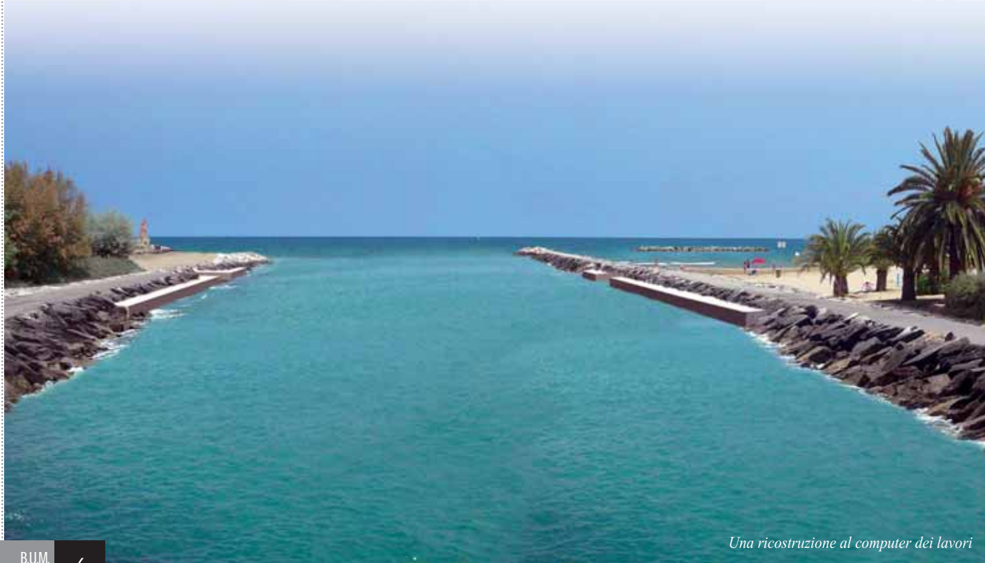
Una ricostruzione al computer dei lavori

L'importo attualmente stanziato per una parte dei lavori, le opere strutturali essenziali, è di 1.820.000 euro, interamente finanziati, attualmente è in corso la procedura di verifica della compatibilità ambientale e si presume che entro l'anno 2011 potrà essere approvato il progetto esecutivo a cui seguiranno le procedure per l'appalto dei lavori.