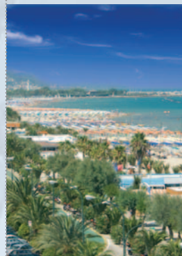
In copertina: foto di A. Cellini

L'assegno di maternità è concesso alle madri che abbiano avuto un figlio nel corso ►