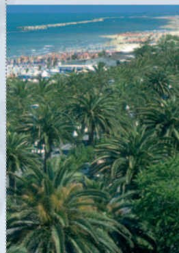
In copertina