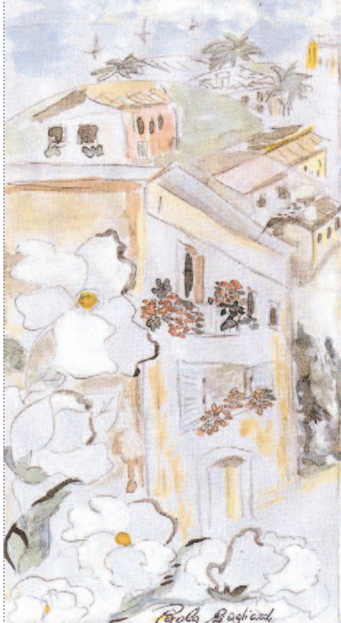
Soc. coop onlus "Lavoriamo insieme" Inserimento lavorativo disabili. Realizzato a mano.

Il Circolo dei Sambenedettesi organizza in collaborazione con l'Amministrazione Comunale di San Benedetto la quarta edizione del concorso "Balconi in fiore", rivolto a tutti coloro che intendono abbellire i propri balconi con composizioni floreali. Al concorso è abbinata la rassegna di poesie "Fiori in poesia", alla quale sono invitati a partecipare tutti i poeti locali con composizioni in lingua o in dialetto con testi dedicati ai fiori. Nella giornata conclusiva, che avrà luogo alla Palazzina Azzurra, saranno premiati i migliori balconi fioriti e sarà dato risalto alla lettura dei testi poetici. Per partecipare bisogna segnalare entro il 31 maggio 2006 la propria disponibilità alla segreteria del Circolo dei Sambenedettesi, telefonando allo 0735/585707 comunicando cognome e nome, via nella quale è ubicata l'abitazione con l'indicazione del piano e riferimento telefonico.