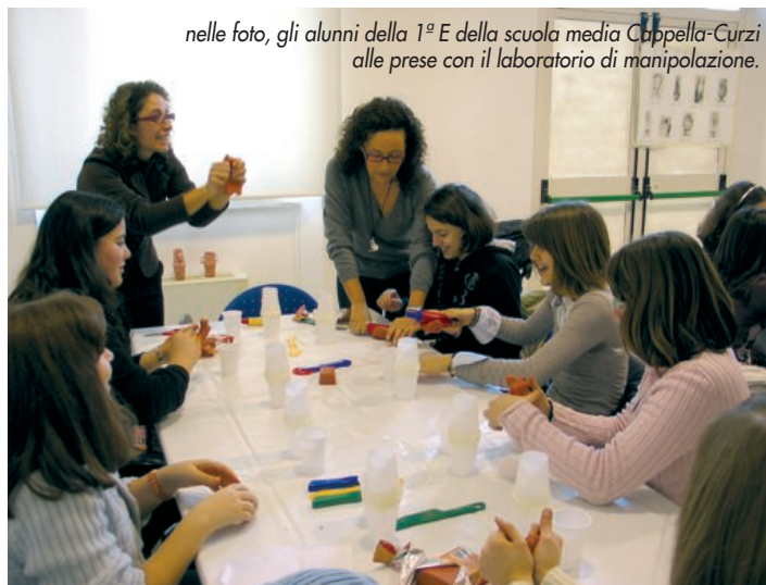
nelle foto, gli alunni della 1ª E della scuola media Cippella-Curzi alle prese con il laboratorio di manipolazione.

Il biglietto per ciascun laboratorio è di 4 euro, e le aule didattiche, della durata di circa un'ora e mezza in orario scolastico, comprendono anche la visita guidata ai due musei. Per informazioni e prenotazioni: tel. 0735.588850, dal martedì al sabato dalle ore 9 alle 13.