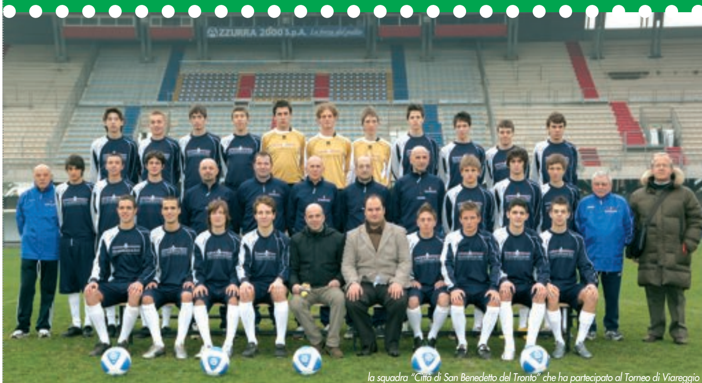
la squadra "Città di San Benedetto del Tronto" che ha partecipato al Torneo di Viareggio

Si è conclusa l'avventura in terra toscana della giovane pattuglia rossoblu che dal 28 gennaio al 5 febbraio 2008 ha partecipato alla Coppa Carnevale, passerella del calcio "verde" e palestra tradizionale per talenti veri. Tracciando un bilancio tecnico della spedizione si può tranquillamente affermare che il calcio giovanile sambenedettese si è comportato alla grande suscitando notevole interesse tra gli addetti ai lavori intervenuti alla manifestazione. Su tutti spicca il giudizio del tecnico Eugenio Fascetti, scopritore di Cassano, che ha rivolto pubblicamente parole di elogio alla pattuglia sambenedettese durante la serata di gala. Molti sono stati gli attestati di stima ricevuti e alla fine quella che era considerata "una scommessa" ha fatto addirittura sognare una storica qualificazione! L'aver perso per un nonnulla contro