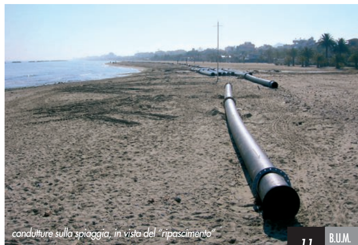
condutture sulla spiaggia, in vista del "ripascimento"