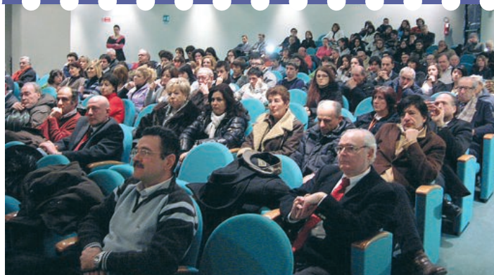
pubblico all'auditorium comunale domenica 27 gennaio