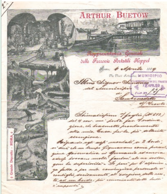
San Benedetto del Tronto, Archivio storico comunale, B. 102.60, anno 1889

il primo mezzo di "trasporto di massa" a costi contenuti via terra. Nella nostra città la "strada ferrata" è arrivata nella seconda metà dell'Ottocento. I pezzi vennero acquistati presso le Ferrovie Portatili Koppel. In questa comunicazione del 1889, indirizzata al Sindaco di "Sambenedetto" dal "Rappresentante italiano delle Ferrovie" Koppel, si può notare una bellissima incisione realizzata da F.L. Meyer di Berlino per questa ditta.