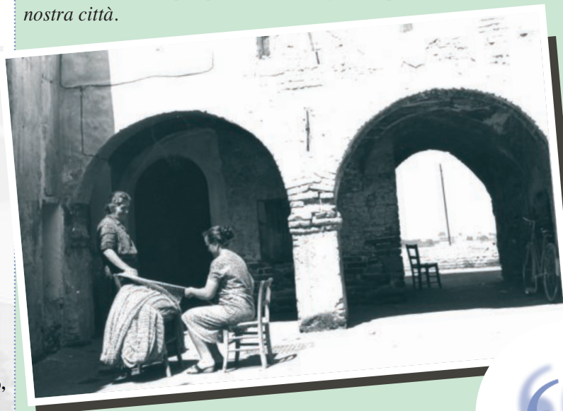
nella foto: Piazza Dante

Stampa: Grafiche Martintype Colonnella (Te) tel. 0861.748980 fax 748994