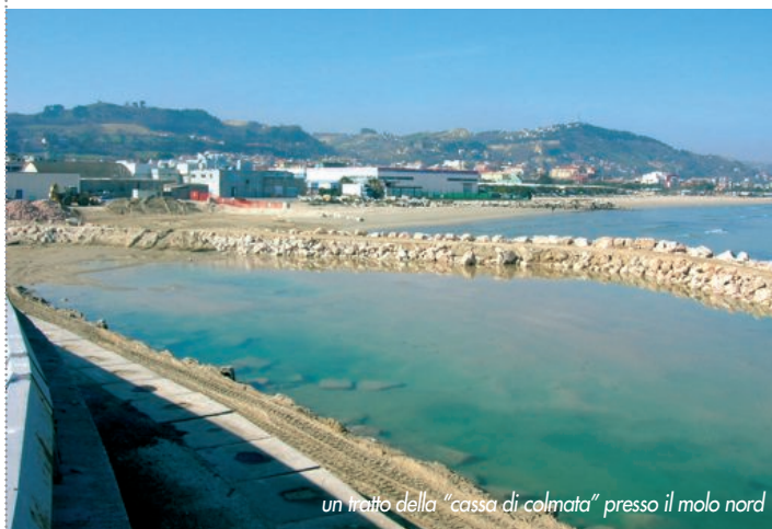
un tratto della "cassa di colmata" presso il molo nord

Come ulteriore precauzione, al momento di effettuare l'escavo dal lotto compatibile, ci si è fermati ad una distanza di sicurezza dal confine con lotti "non compatibili", per non incorrere in alcun rischio di contaminazione. L'intera operazione, eseguita dalla ditta Gregolin di Venezia, è stata monitorata e seguita dall'assessorato alle Politiche del mare, oltre che dagli altri organismi competenti, per evitare ogni sorta di disguido.