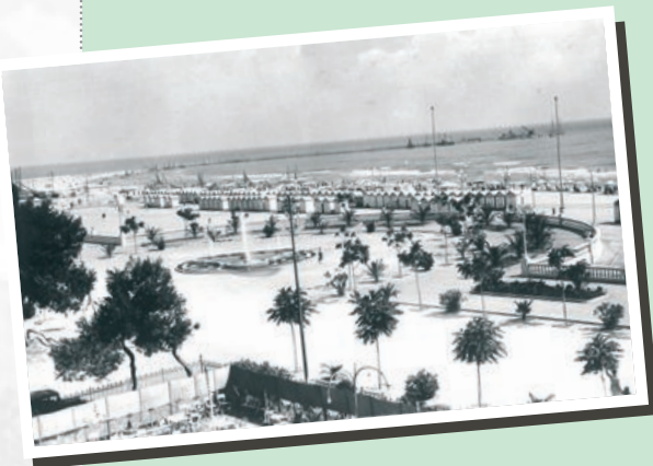
nella foto: la Rotonda in copertina: la Rotonda ed il faro

Concessionaria di pubblicità: Sonia Roscioli Communication tel. 0735.591154 - port. 393.6921090 Stampa: Fast Edit Acquaviva Picena (AP) tel. e fax 0735.765035