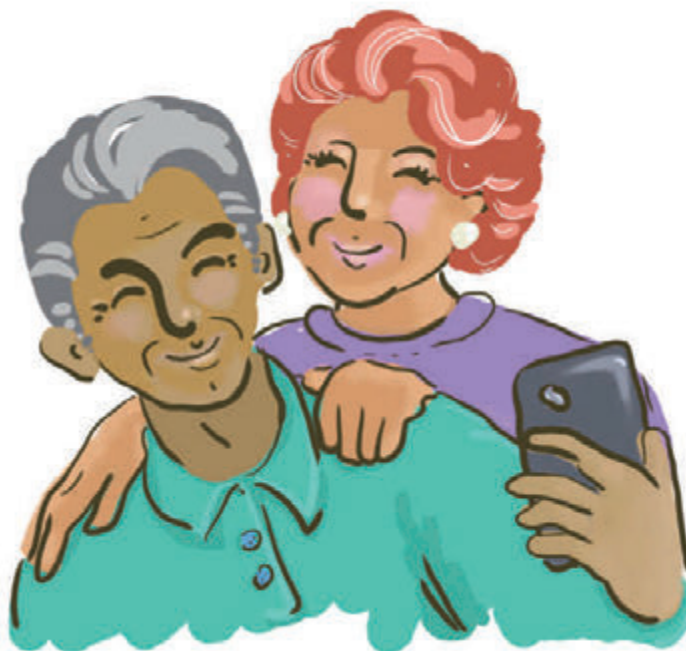
disegno di Belinda Menzietti

Sfumature? Forse, ma consideriamo il punto di vista di un venditore di padelle tecnologiche o di un famoso chef che abbia in animo di lanciare un nuovo corso di cucina a pagamento. In entrambi i casi, il web analyst scriverà dei rapporti nei quali i protagonisti saremo noi, anche perché abbiamo visualizzato due volte il filmato del perfetto ribaltamento di frittata e subito dopo abbiamo cliccato sull'immagine della super padella mostrata.