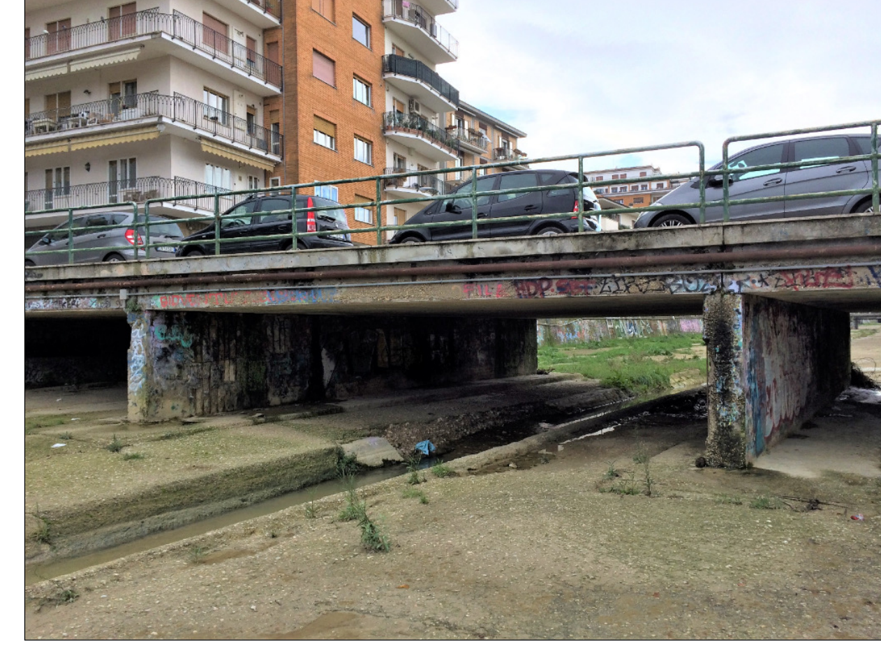
FOTO PONTE di via PIEMONTE lato MONTE