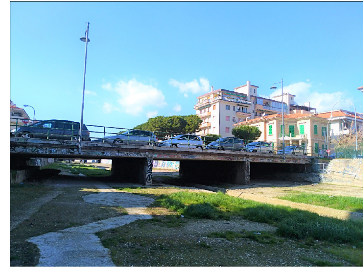
FOTO PONTE di via PIEMONTE lato VALLE

NOTA BENE: LE TUBAZIONI SPOSTATE DOVRANNO ESSERE OPPORTUNAMENTE ALLACCIATE ALLE LINEE ESISTENTI IN CORRISPONDENZA DELLE SPALLE