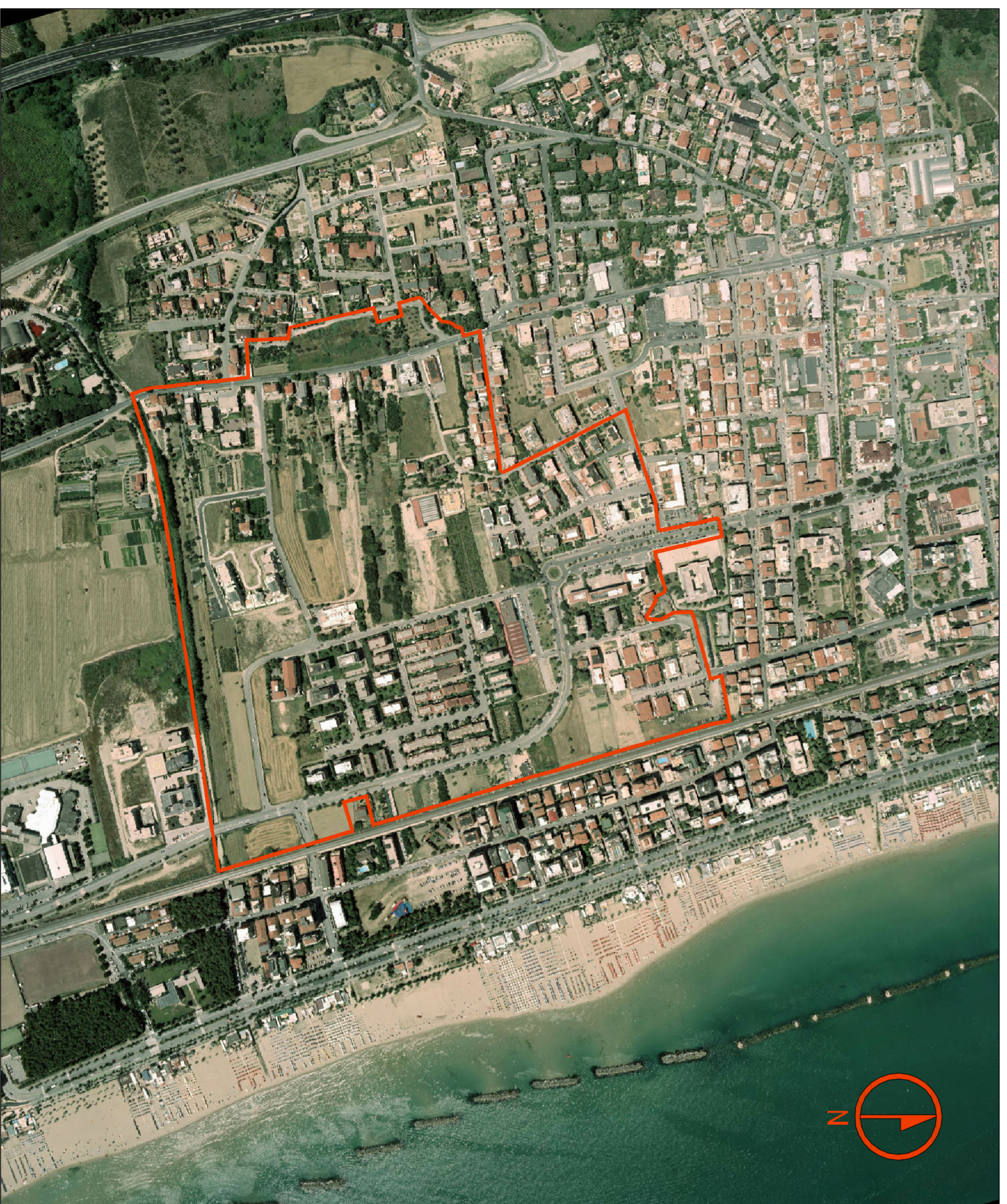
FOTO AEREA QUARTIERE SAN PIO X E MARINA DI SOTTO