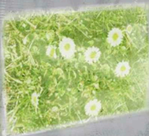
Immagine di Elisa Baldissera, secondo premio Concorso Illustrazione EURHOPE 2013 ( www.eurhope.net )