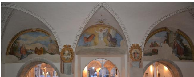
Particolari della Sala Cola D'Amatrice, Ascoli P.