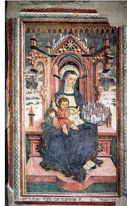
Affreschi Icona Passatora, Amatrice