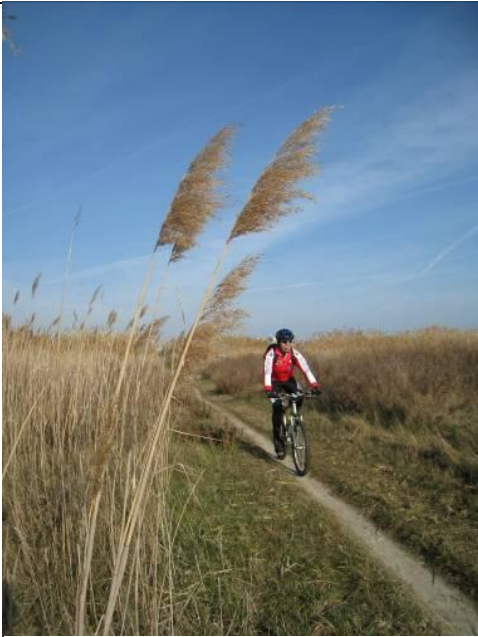
Il percorso ciclabile del Tronto

Sezioni di Ascoli Piceno e S. Benedetto del Tronto