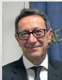
Il Sindaco Pasqualino Piunti