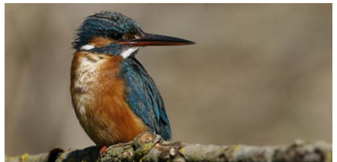
Martin pescatore - Alcedo Atthis