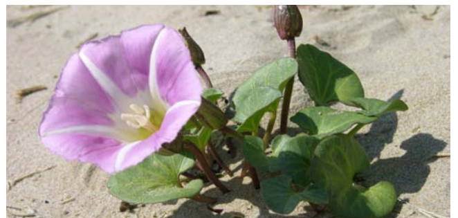
Soldanella - Calystegia soldanella