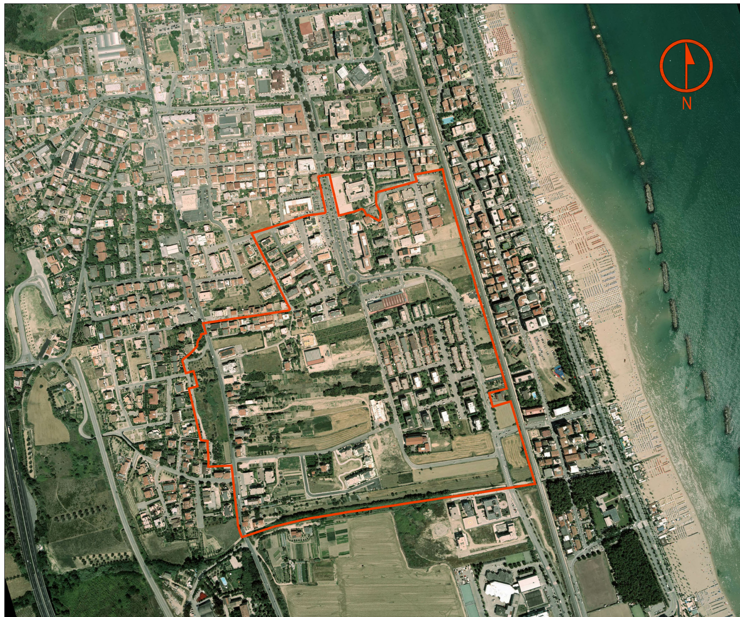
FOTO AEREA QUARTIERE SAN PIO X E MARINA DI SOTTO