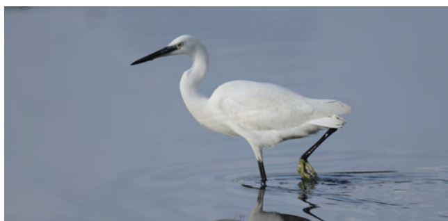
Garzetta - Egretta garzetta