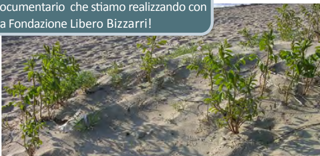
Liquirizia - Glycyrrhiza glabra

Cerca la Riserva della Sentina su You tube! Troverai il trailer del documentario che stiamo realizzando con la Fondazione Libero Bizzarri!