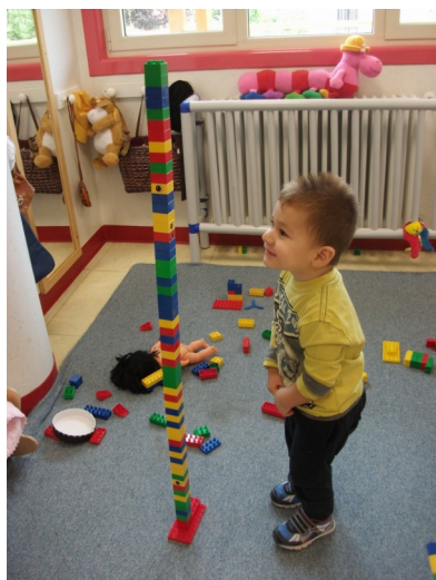
La torre di Emanuele

La frequenza comporta il pagamento di una retta e riduzioni in caso di assenza per malattia. Il costo del pasto è corrisposto con la Junior Card secondo le modalità della scuola dell'infanzia.